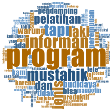
Gambar 1. World Cloud

Frekuensi ini juga menunjukkan bahwa perhatian utama informan bukan hanya pada bantuan awal, tetapi juga pada kelangsungan usaha melalui pelatihan lanjutan, evaluasi rutin, serta akses pasar. Oleh karena itu, hasil ini dapat menjadi masukan penting dalam merancang model pendampingan yang lebih komprehensif dan berkelanjutan.